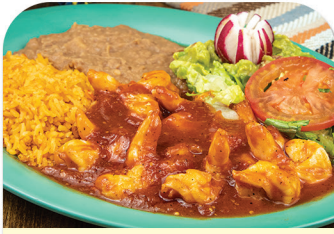
CAMARONES A LA DIABLA