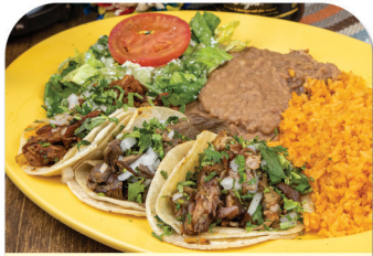
TACOS PLATE COMBO