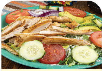
ENSALADA DE POLLO