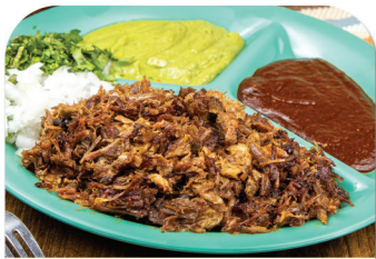
BARBACOA DE BORREGO