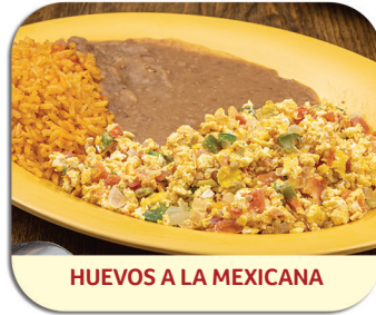
HUEVOS A LA MEXICANA