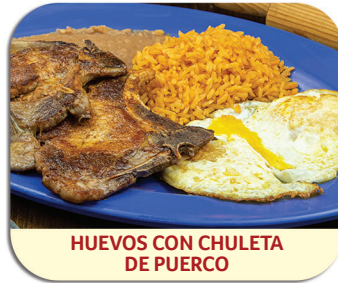
HUEVOS CON CHULETA DE PUERCO