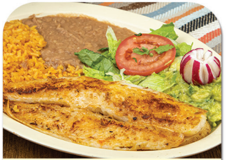
FILETE A LA PLANCHA