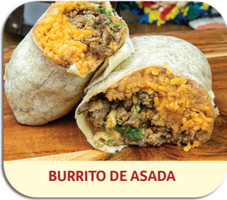
BURRITO DE ASADA