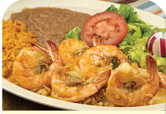
CAMARONES AL MOJO DE AJO