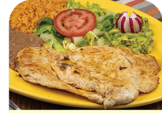
PECHUGA A LA PLANCHA