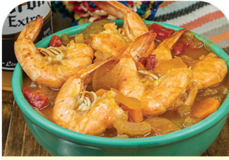
CALDO DE CAMARON