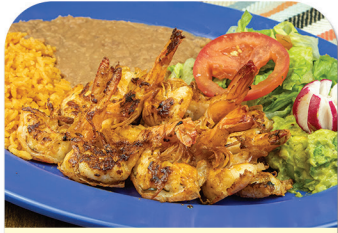
CAMARONES A LA PLANCHA