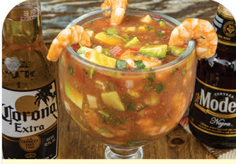
COCTEL DE CAMARON