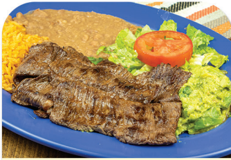
RANCHERA A LA PLANCHA