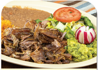
COMBINACION DE CARNITAS